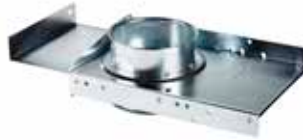
Handschieber mit Kunststoffdichtung