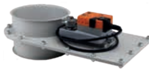
Elektroschieber 24 V AC/DC